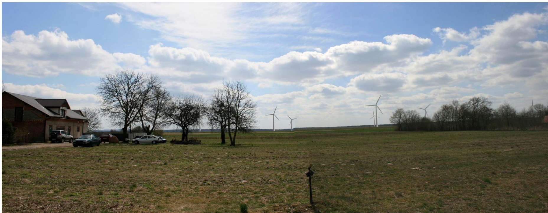
Fot. 1. Przykładowa wizualizacja farmy wiatrowej (widzianej z odległości ok. 900 m)