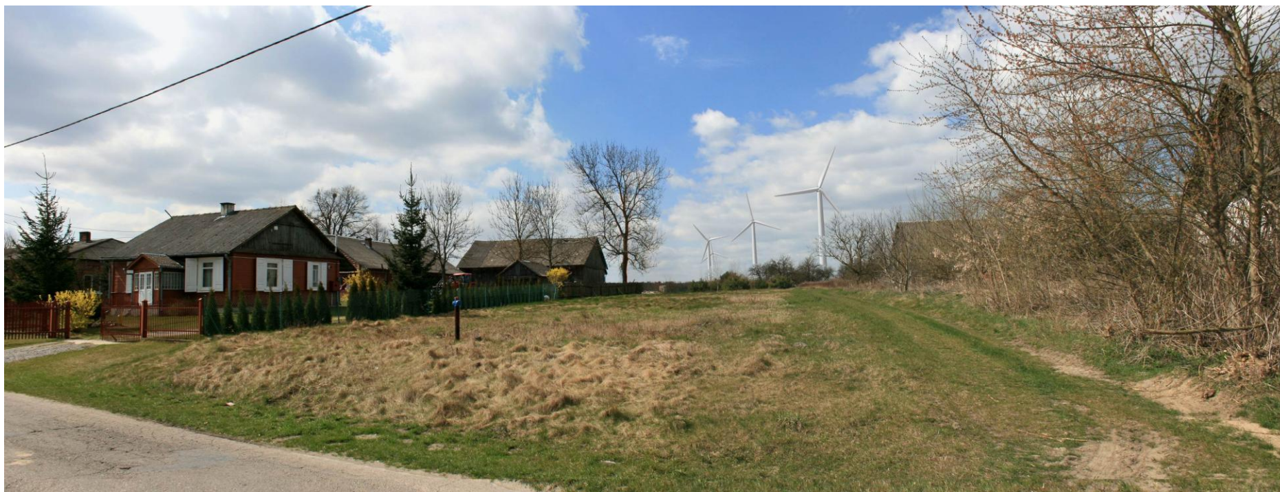
Fot. 2. Przykładowa wizualizacja farmy wiatrowej.