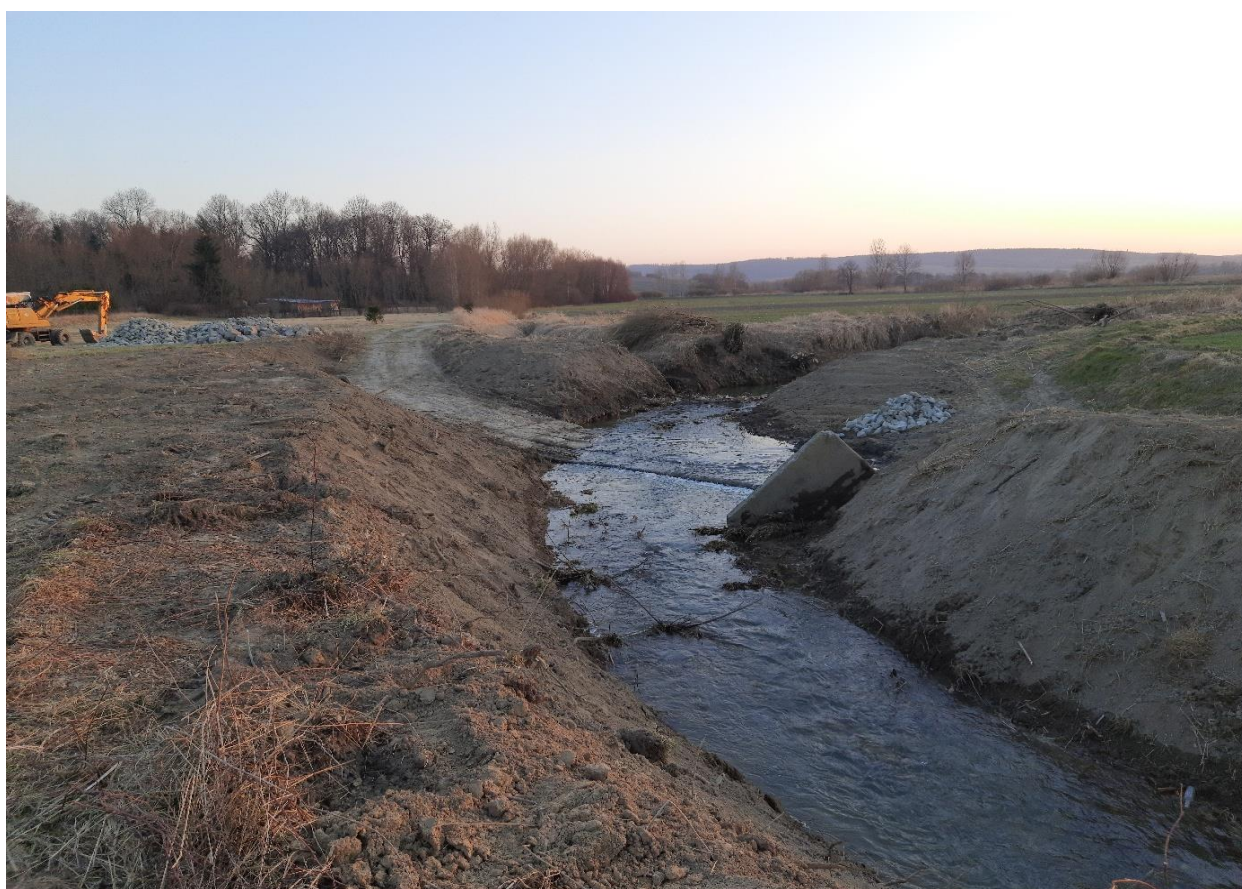
Fragmety rzeki Mleczki