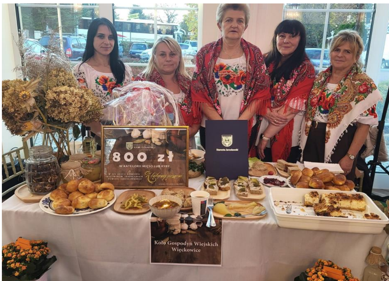
Członkinie KGW w Więckowicach