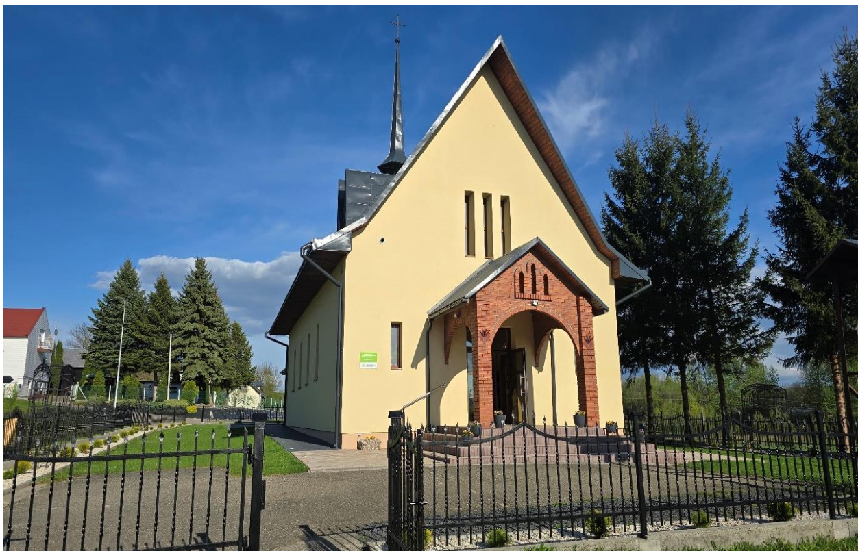
Kościół rzymskokatolicki pod wezwaniem Trójcy Świętej w Więckowicach