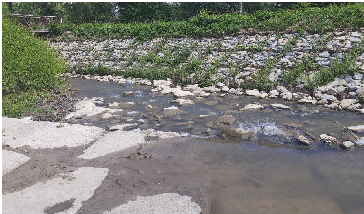
Fragment rzeki Mleczki