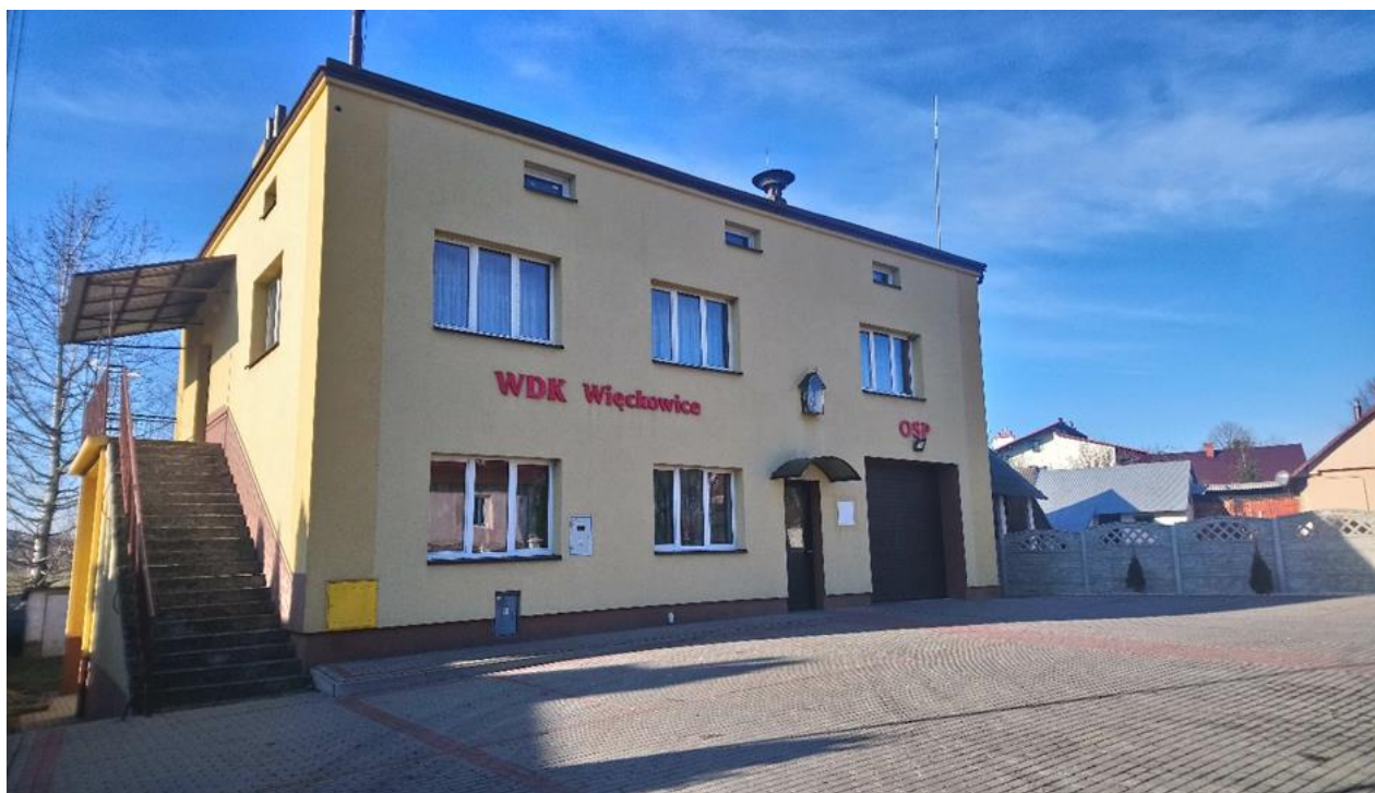
Świetlica Wiejska wraz z Remizą OSP w Więckowicach