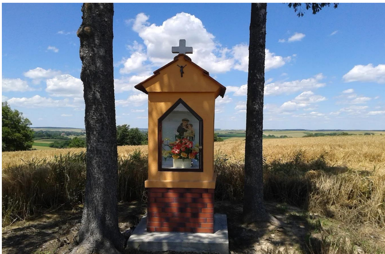
Kapliczka przydrożna / św. Antoni