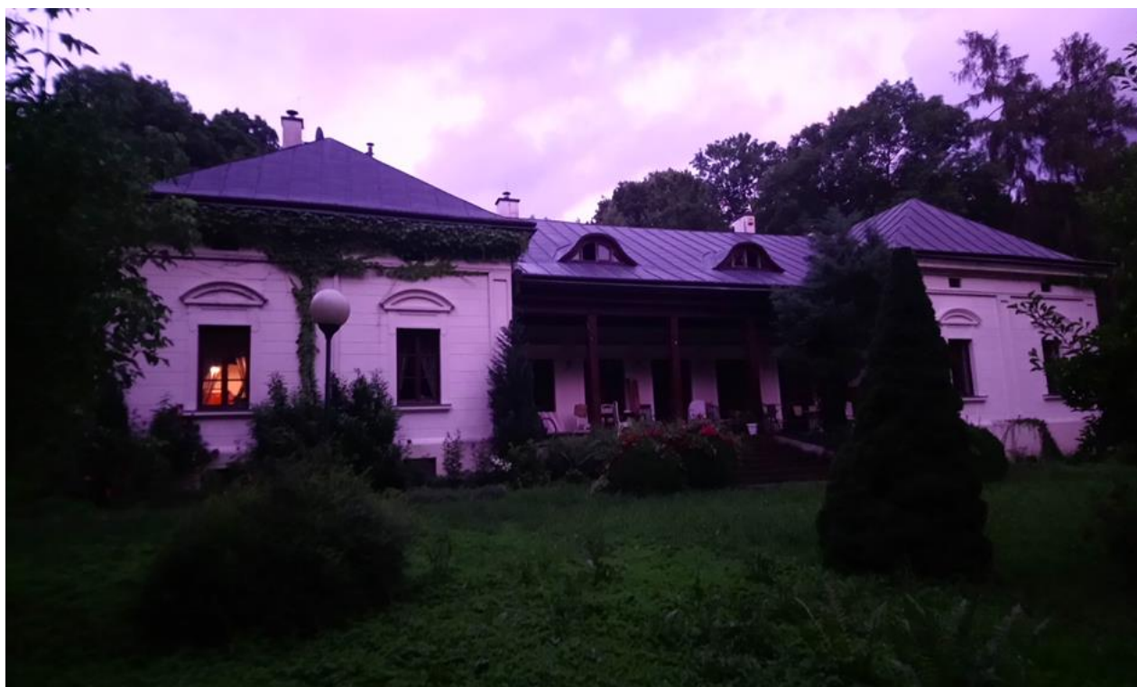
Dwór murowany w Więckowicach