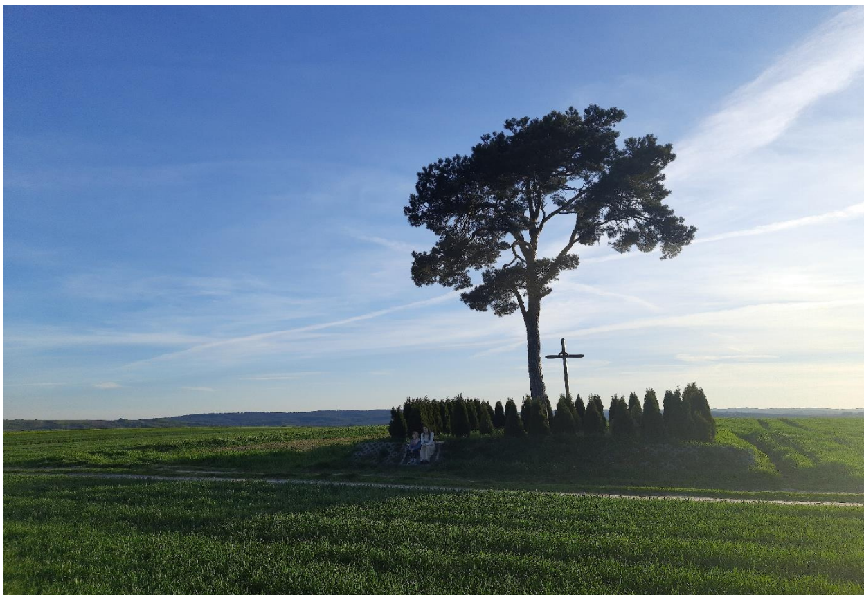
Cmentarz Choleryczny w Więckowicach