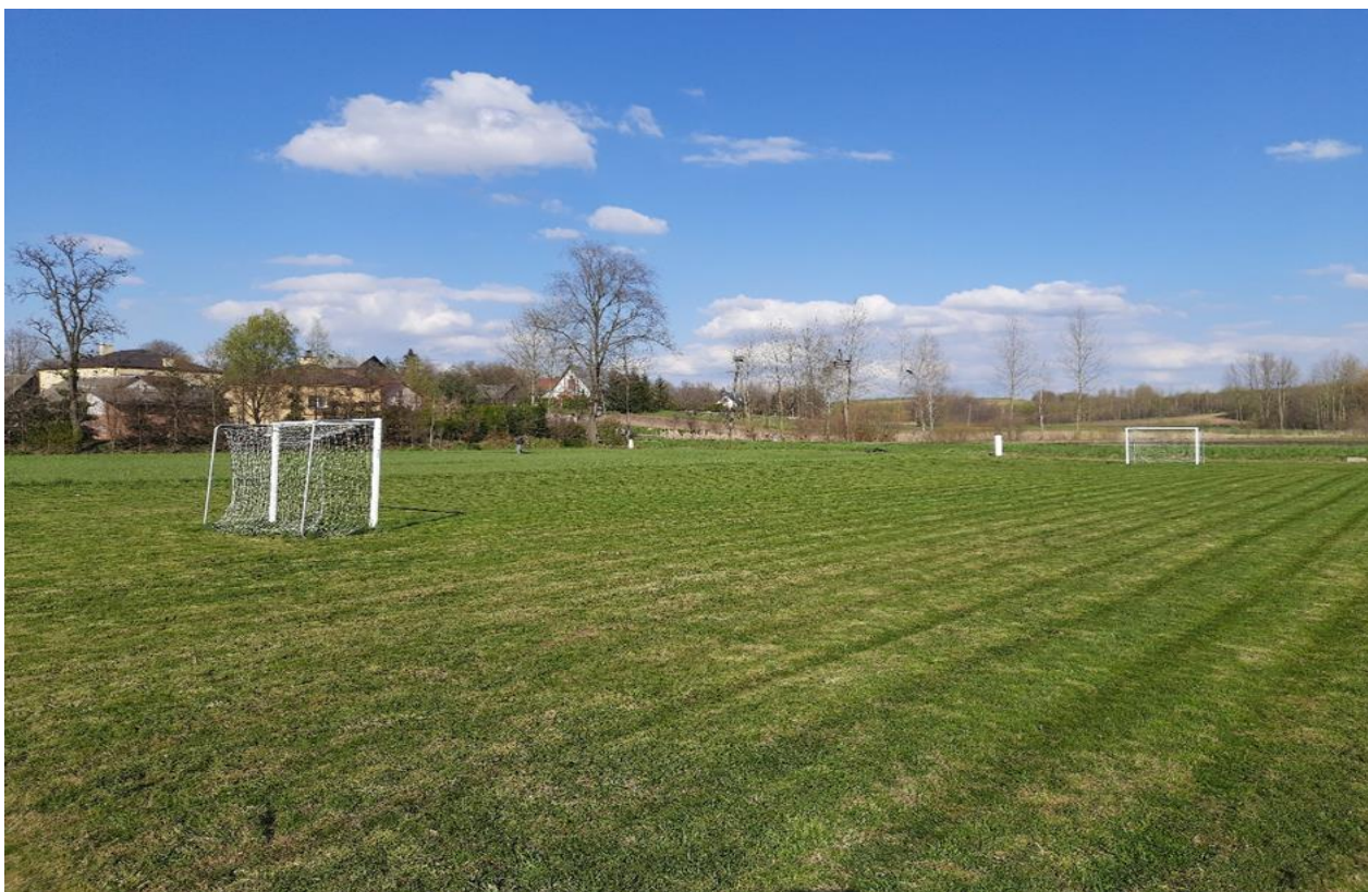
Boisko sportowe w Więckowicach