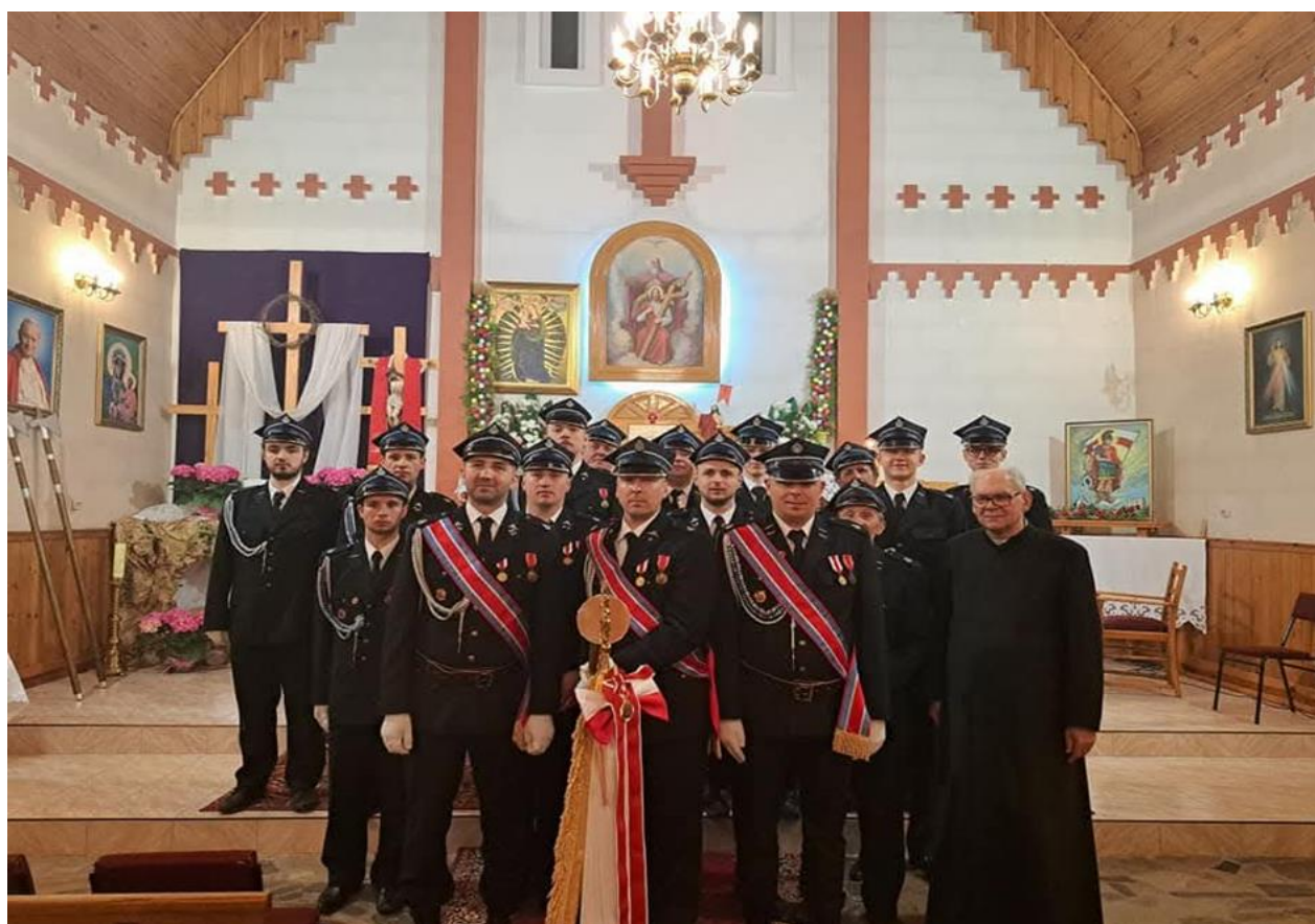
Członkowie OSP Więckowice