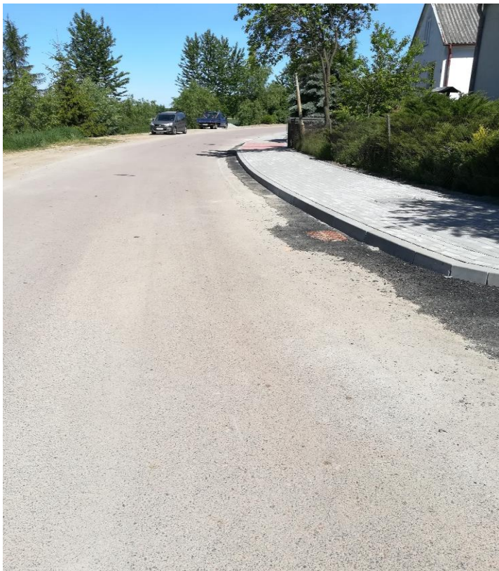
Chodnik wykonany w 2024 roku -150m