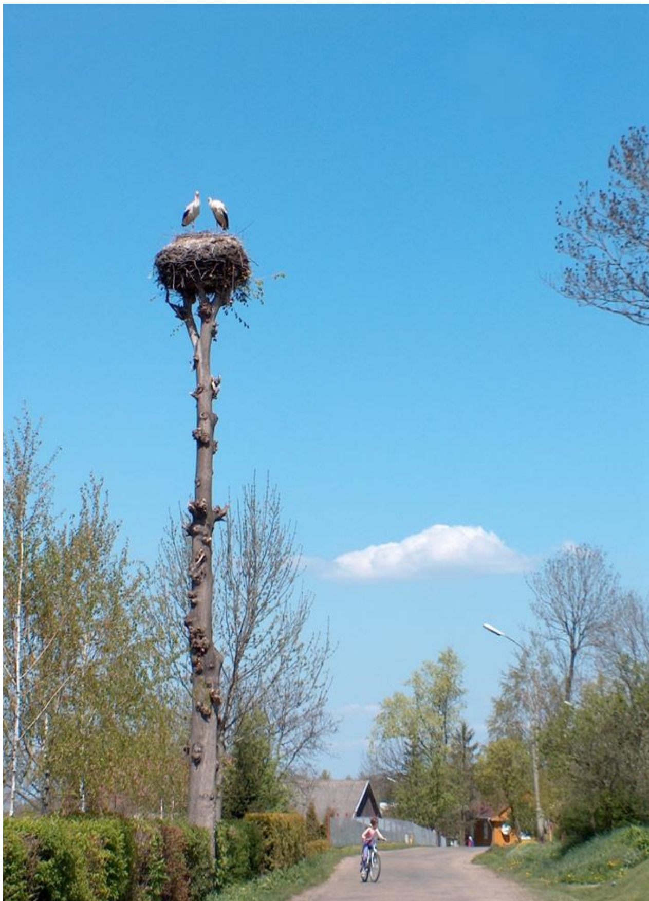
Przyrodnicze walory Więckowic