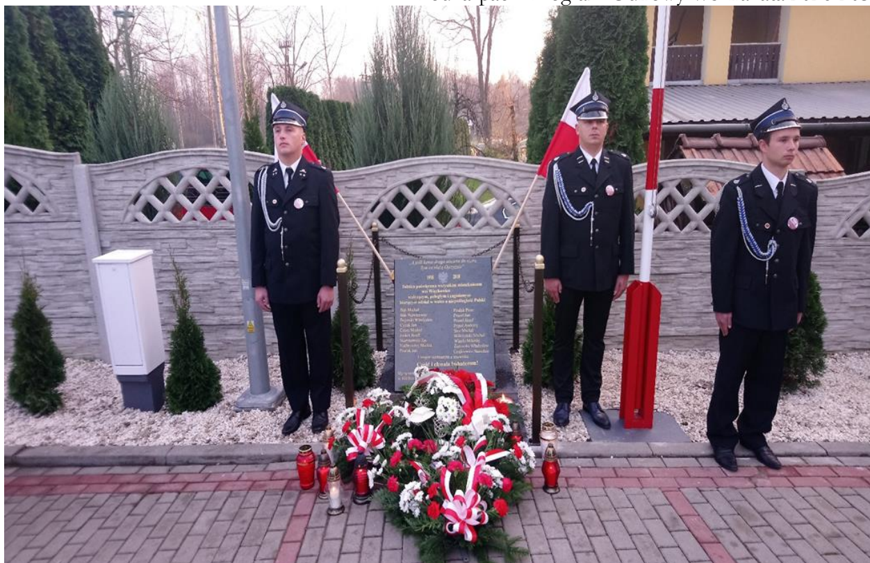
Uroczystość upamiętniająca. Straż honorowa OSP Więckowice.